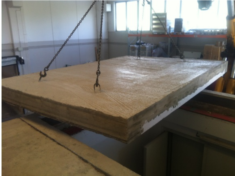
Immagine 3. Solaio Airfloor realizzato a pié d'opera e posizionato sopra la camera acustica