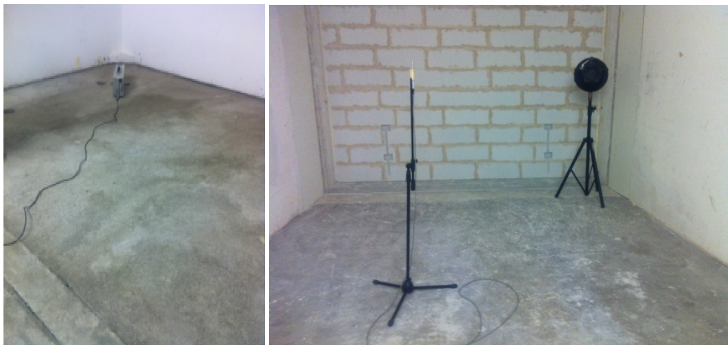
Immagine 5. Strumentazione superiore ed inferiore per le verifiche sperimentali dei pacchetti