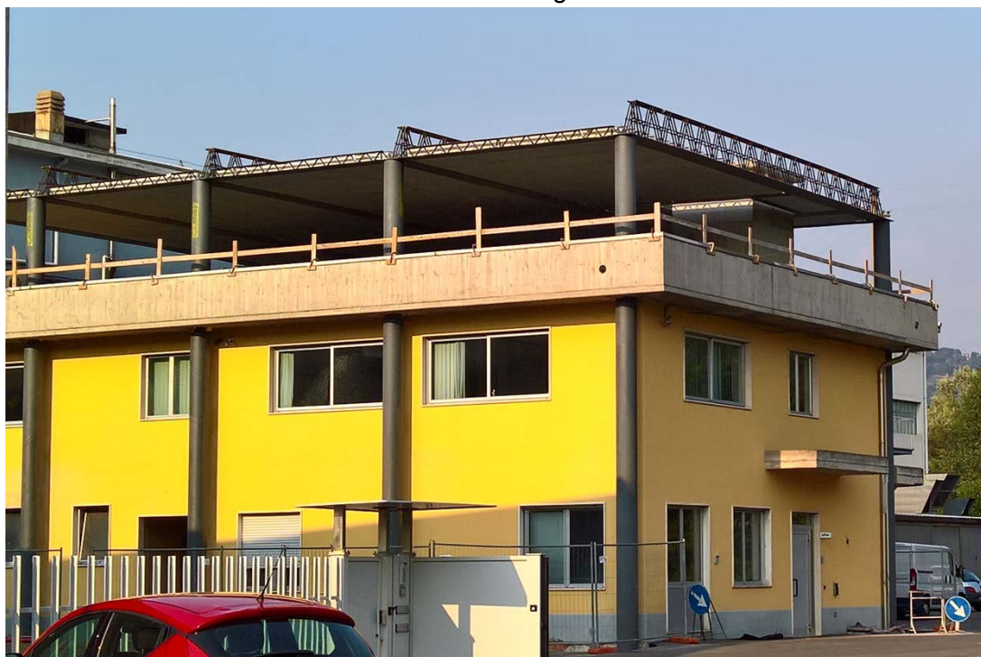
Immagine 2. Esempio di sopraelevazione realizzato con travi e pilastri NPS abbinati al solaio Airfloor™

Grazie alla sua leggerezza e autoportanza la posa del solaio risulta semplice e veloce. Una caratteristica, la leggerezza, che rende questo tipo di solaio ideale in caso di sopraelevazioni di edifici esistenti o di nuove costruzioni sismo-resistenti grazie ai minori carichi sulle fondazioni.