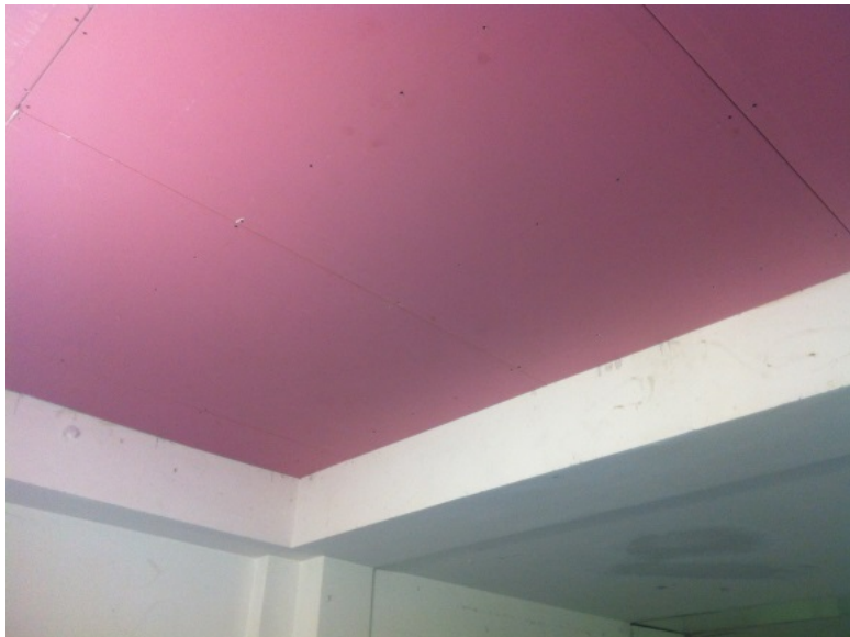
Immagine 4. Interno della camera acustica: solaio rivestito con cartongesso