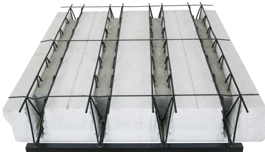
Immagine 1. Pannello di solaio Airfloor

Airfloor è il solaio prefabbricato autoportante più leggero disponibile sul mercato, con un peso a secco pari a 45kg/mq e dopo il getto di completamento di 190 kg/mq.