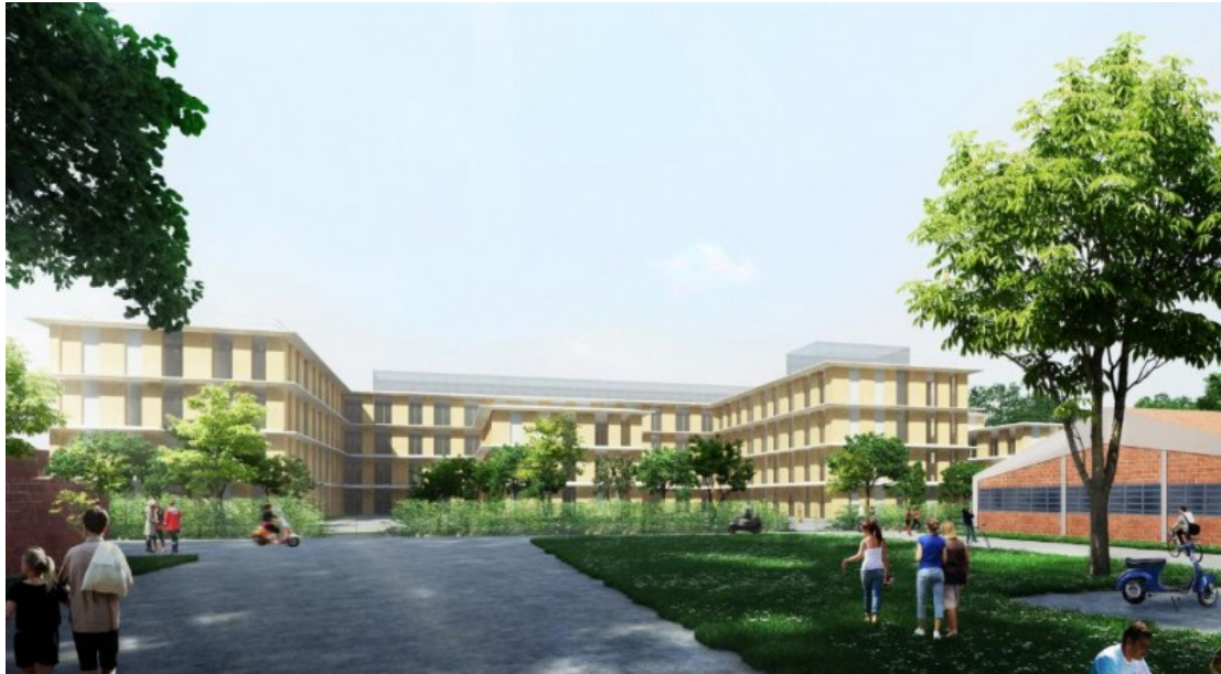
Ingresso principale dell'Ospedale per piccoli animali

La filosofia che caratterizza lo Studio di Kengo Kuma, fondata sul rispetto e la valorizzazione del paesaggio culturale e naturale esistente si declina anche nel progetto del campus universitario di Lodi. Il contesto agricolo destinato al nuovo campus, caratterizzato da un articolato sistema di rogge e canali, è stato scelto come elemento fondamentale del progetto, allo scopo di creare un forte legame con il paesaggio della campagna lodigiana. Grandi vetrate consentiranno alla natura di entrare all'interno dell'edificio durante tutte le stagioni, permettendo al paesaggio di farsi parte integrante del progetto stesso. La cura per il legame con il territorio si rifletterà anche nella scelta dei materiali: legno, pietra e vetro, per sfumare il più possibile la percezione del confine tra architettura e natura.