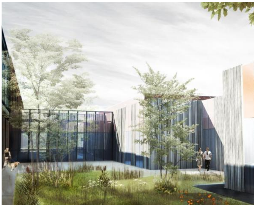
Vista del patio dell'Università