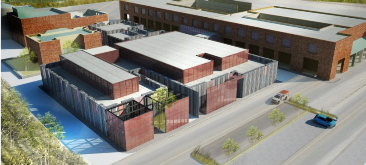
Vista aerea dell'Università

La nuova sede della facoltà di Medicina Veterinaria ospiterà circa 2.200 studenti, oltre a 300/400 unità tra personale docente, tecnici di laboratorio, dottorandi, dipendenti tecnico/amministrativi e di servizio. Le dimensioni dei lotti 1 e 2 sono pari a circa 40.000 mq, su cui sono stati edificati 25.000 mq di impalcati. I 2 lotti sono stati volutamente progettati con funzioni diverse. Di conseguenza, anche la progettazione strutturale dei due lotti ha seguito strade separate. In entrambi travi e pilastri sono a struttura mista acciaio-calcestruzzo NPS®. Cambia invece il tipo di solaio, alveolare nel lotto 1, predalles nel lotto 2.