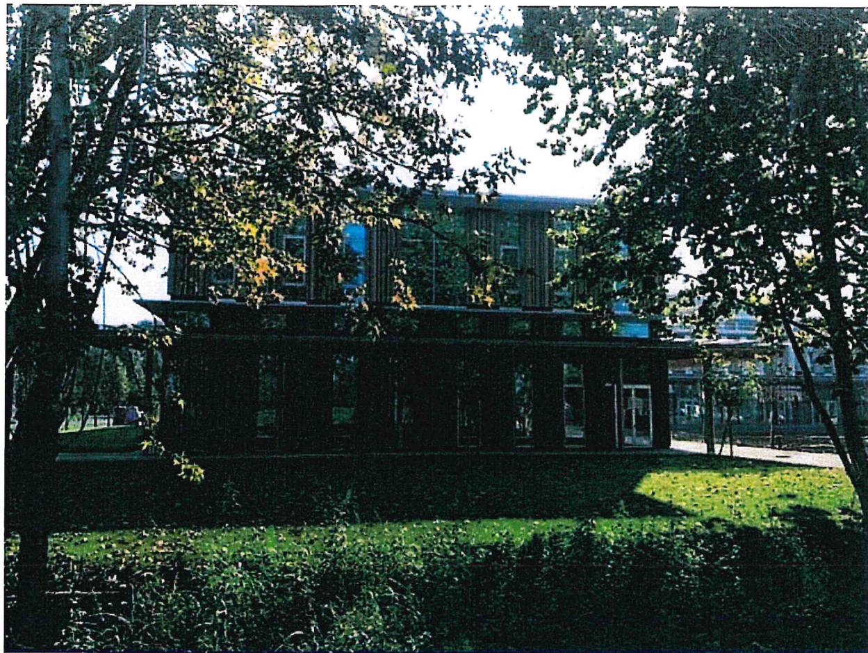
La nuova facoltà di Veterinaria dell'Università di Lodi progettata da Kengo Kuma