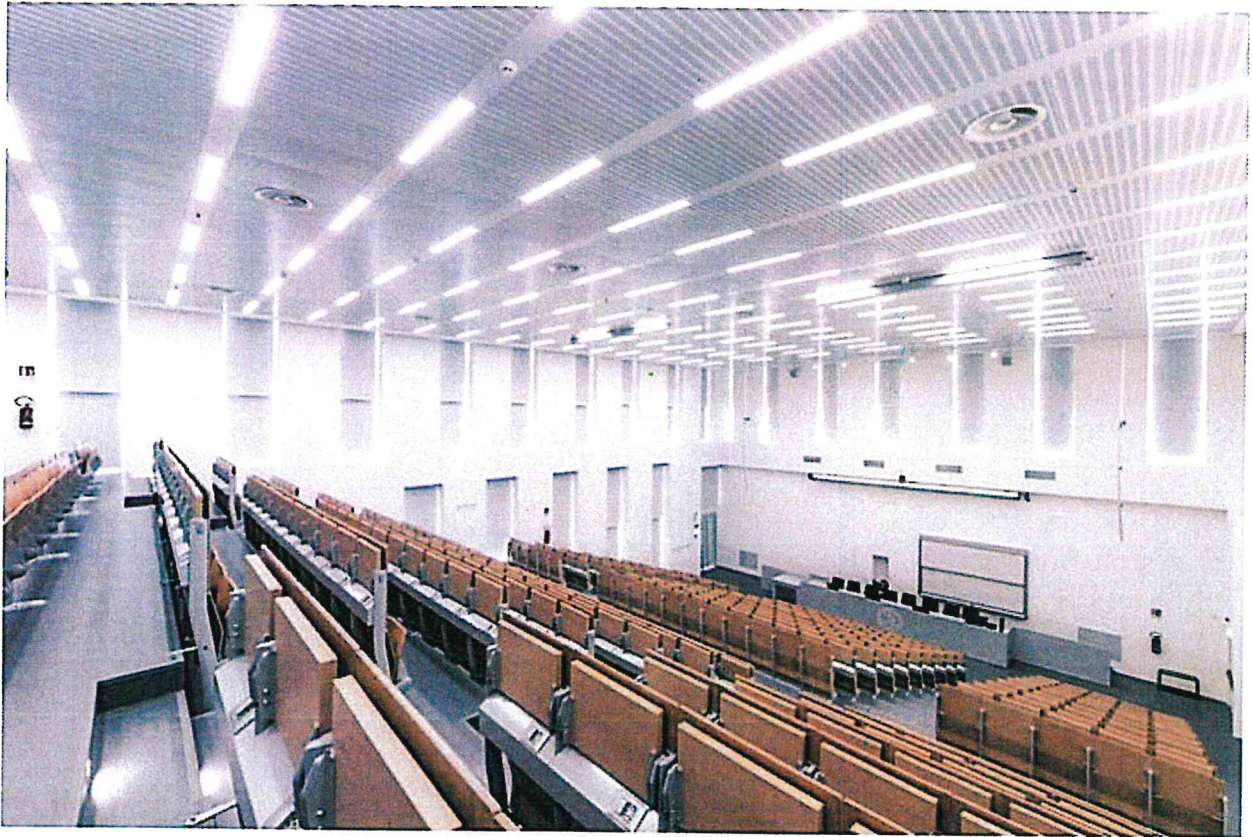
La nuova facoltà di Veterinaria dell'Università di Lodi progettata da Kengo Kuma