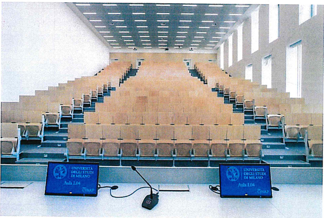
La nuova facoltà di Veterinaria dell'Università di Lodi progettata da Kengo Kuma