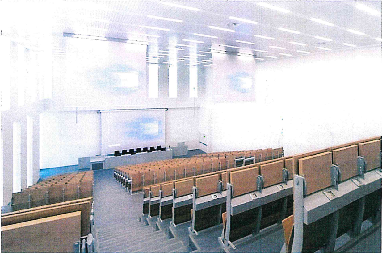
La nuova facoltà di Veterinaria dell'Università di Lodi progettata da Kengo Kuma