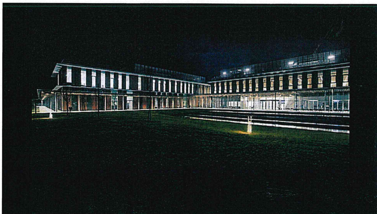
La nuova facoltà di Veterinaria dell'Università di Lodi progettata da Kengo Kuma