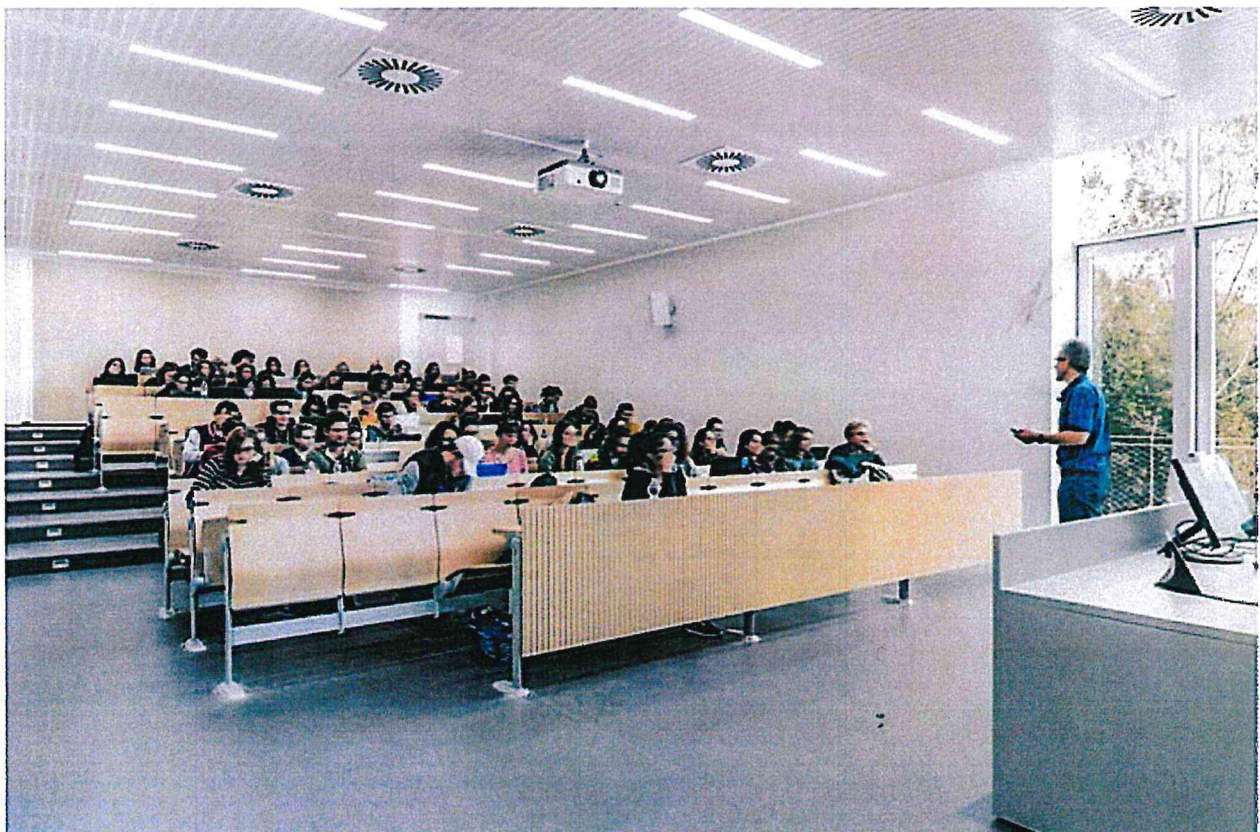
La nuova facoltà di Veterinaria dell'Università di Lodi progettata da Kengo Kuma